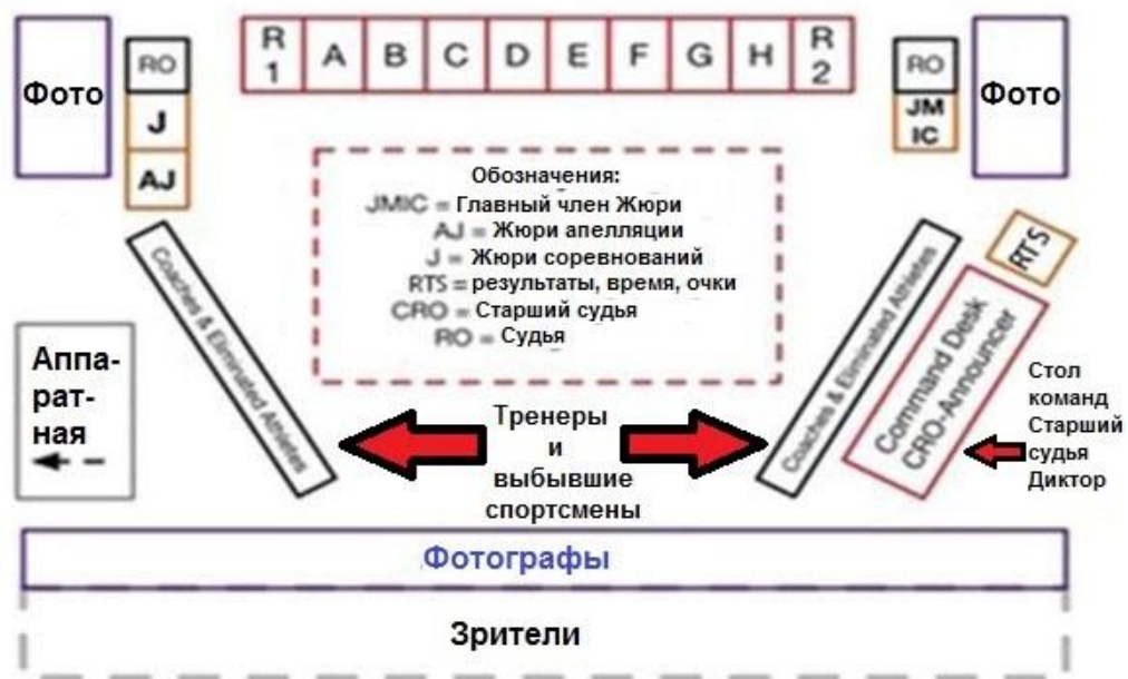
Расположение персонала на финалах по Винтовке и Пистолету